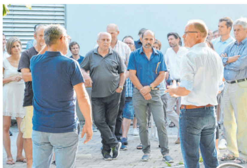
Beim Unternehmerabend präsentierten die Gastgeber von Müller Wohnbau eine neu errichtete Wohnanlage in der Altacher Rheinstraße.