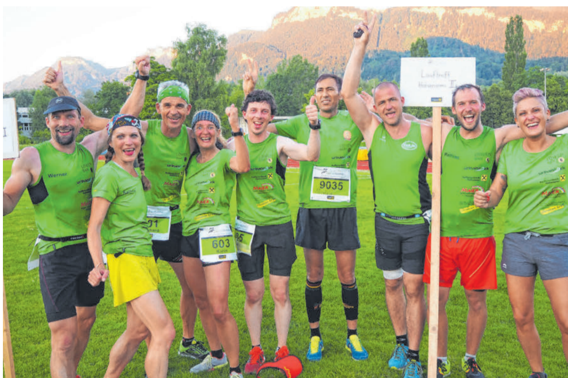
Der Hohenemser Laufftreff dominierte die Gruppenwertung mit Platz eins und zwei. EGLE